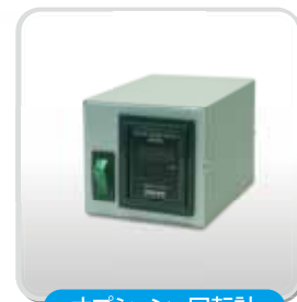
オプション: 回転計